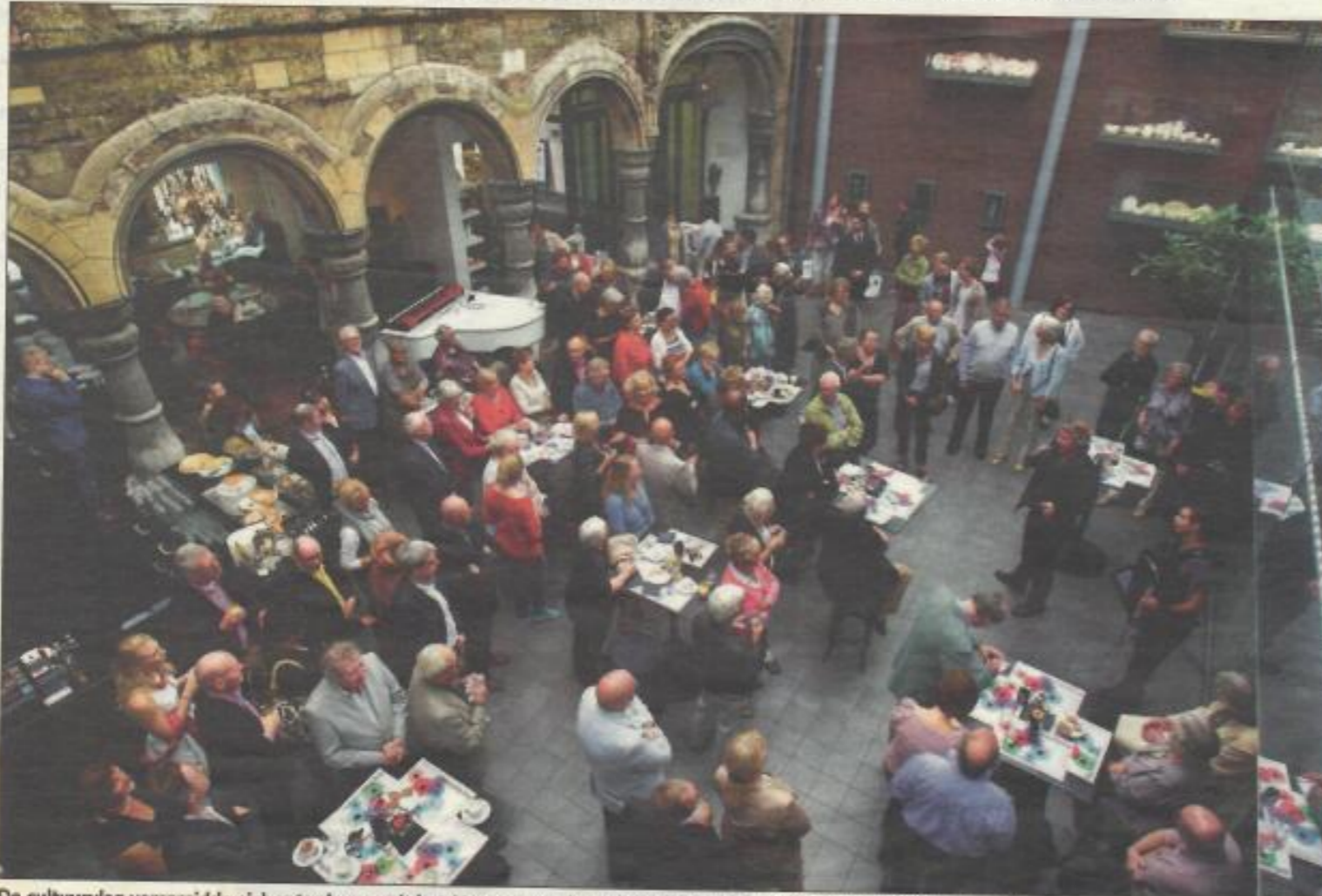
De cultuurvlag verspreidde zich zaterdag vanuit het Museum aan het Vrijthof naar de binnenstad en het Statenkwartier.