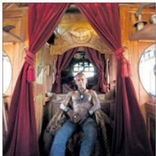
Uit een project over het Landbouwbelang.