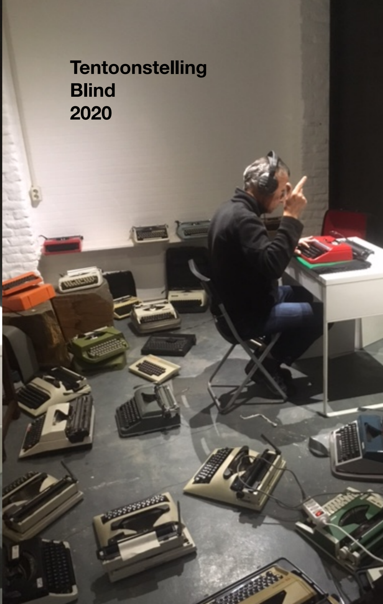
Tentoonstelling Blind 2020