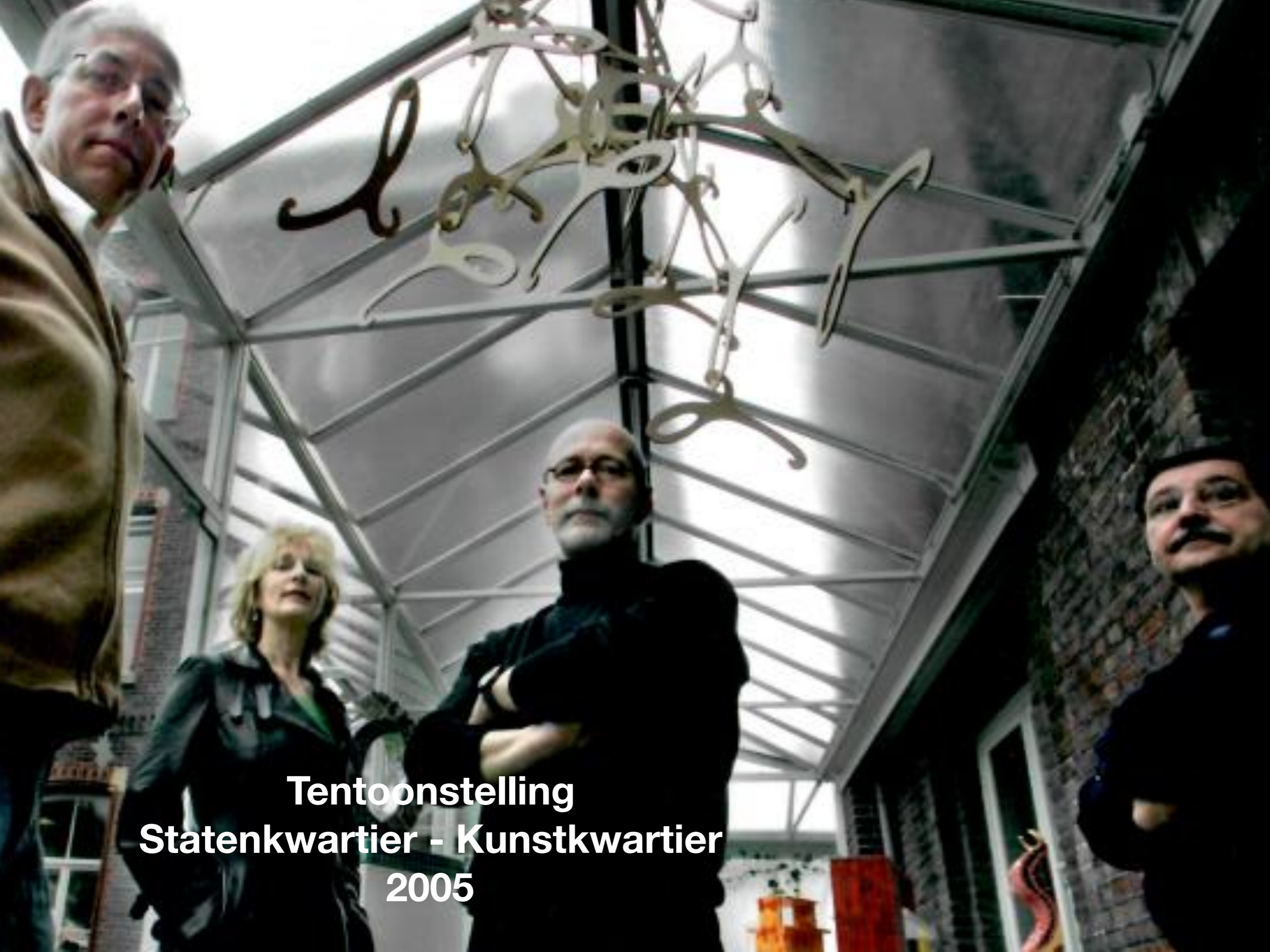
Tentoonstelling Statenkwartier - Kunstkwartier 2005