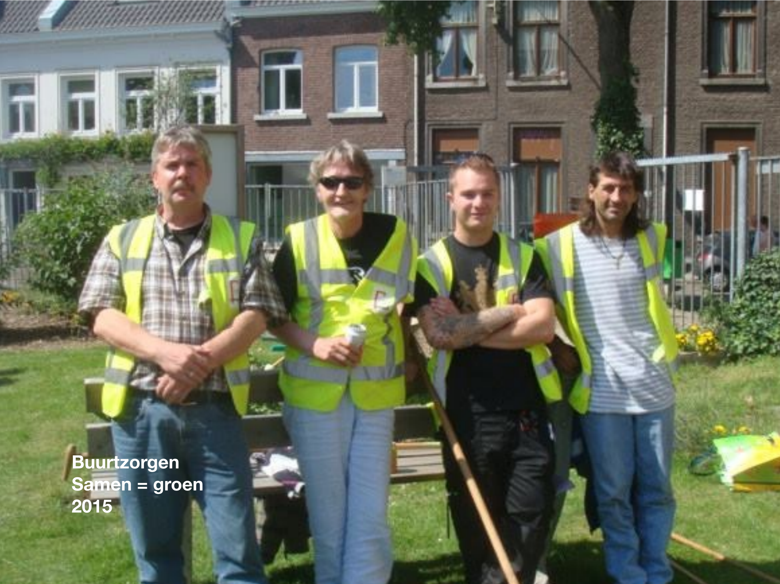
Buurtzorgen Samen = groen 2015