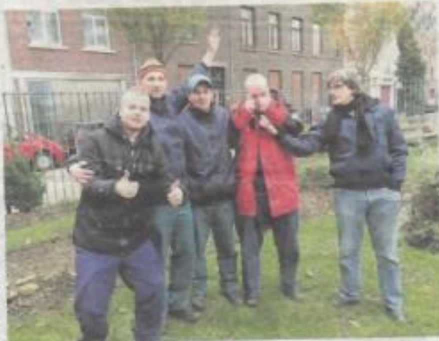
De bewoners van het daklozen opvangcentrum 'Singel 9' van het Leger des Heils helpen een handje mee in de buurttuin van het Statenkwartier.

De vraag werd met veel enthousiasme beantwoord, want aldus een van de bewoners: "Wij willen ons heel graag als vrijwilliger inzetten voor deze tolerante buurt en ook willen