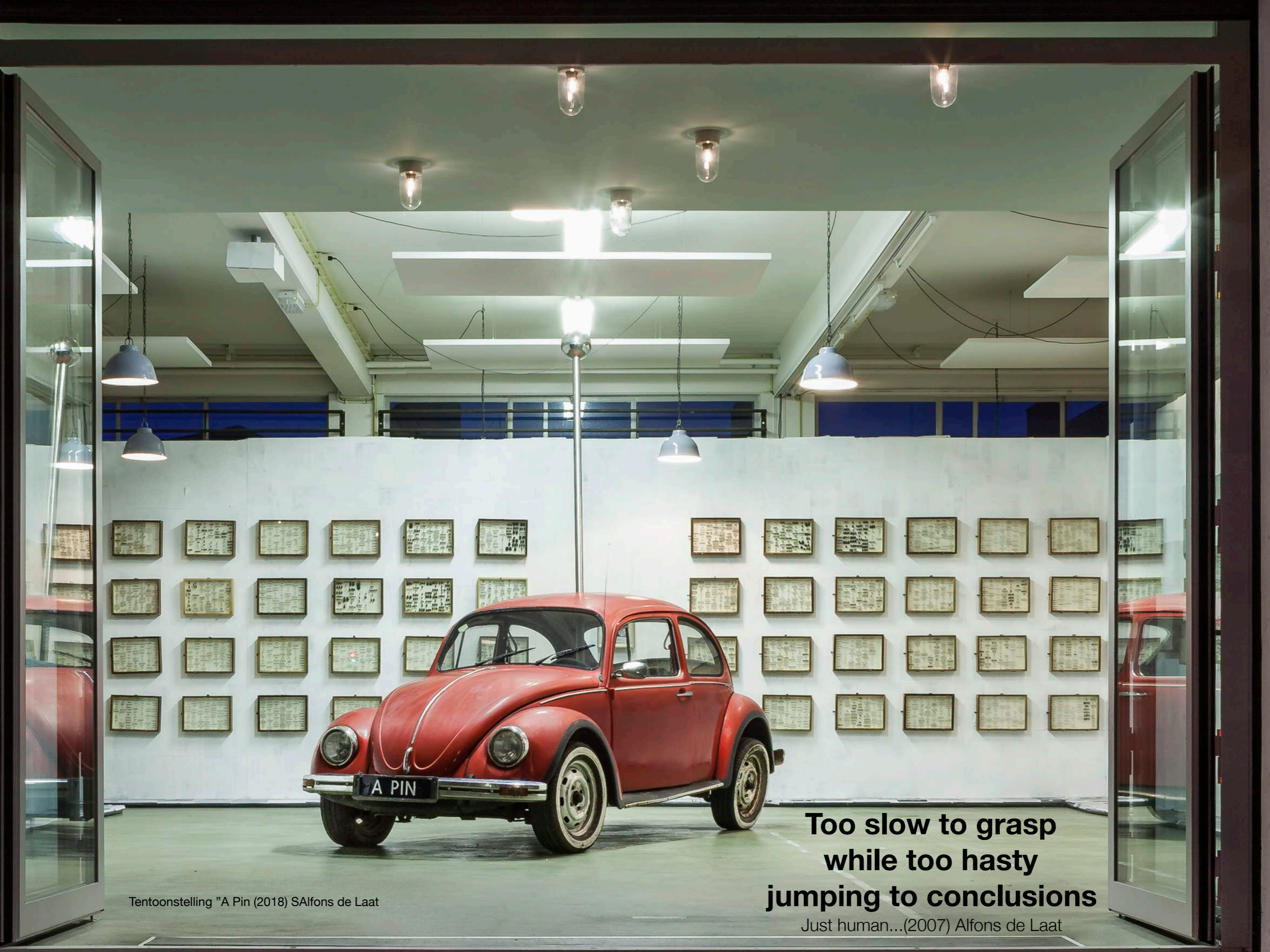
Tentoonstelling "A Pin (2018) SAlfons de Laat

Too slow to grasp while too hasty jumping to conclusions