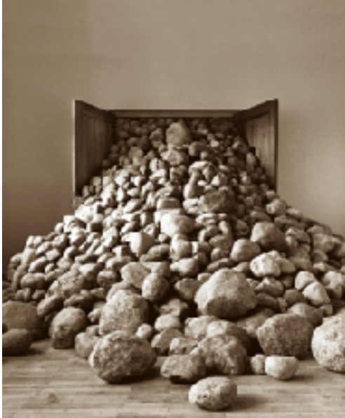
message 2000 Saulius Vaitiekunas door, field stones. ~ 8 tons, fieldstones 800 x 450 x 230