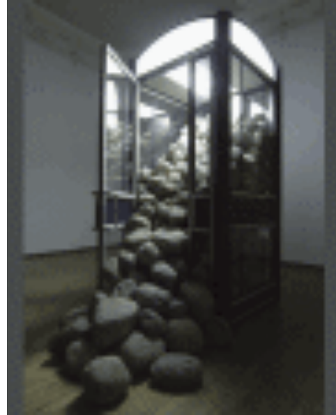
message 2005 Saulius Vaitiekunas original phone cabin, original phone cabin,

het idee voor de Nederlandse versie van de Boederschap is tot stand gekomen na een zoektocht (2009) naar Nederlandse kiezel-steen in het kader van het project „living together”