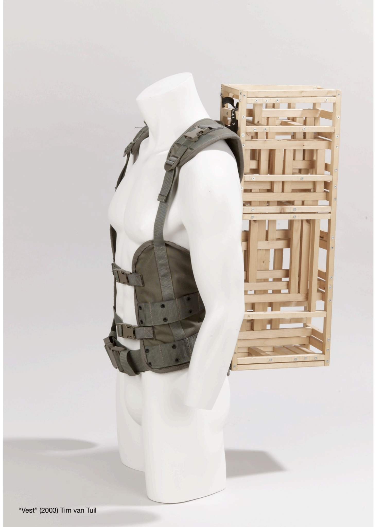
“Vest” (2003) Tim van Tuil

De scheidslijn, in krijt tussen het tijdperk der reptielen en zoogdieren met op het topje van de berg “ons”huidige antropogeen - menselijke tijdperk.